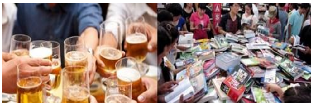
“Nhậu” nhiều, đọc ít và sự lên ngôi của văn hóa rẻ tiền

Người Việt chi ra 3 tỷ đô la để tiêu thụ 3 tỷ lít bia mỗi năm, nếu chia đều trên bình quân dân số mỗi người từ mới lọt lòng đến gần về thiên cổ sẽ “gánh” hơn 33 lít!. Một con số kinh hoàng, không sai nếu xếp bia rượu vào quốc nạn, nhớ ngày xưa Bác Hồ nói thực dân Pháp đầu độc dân tộc ta bằng rượu cồn... thì nay chúng ta đã tự mua cò đầu độc chính mình.