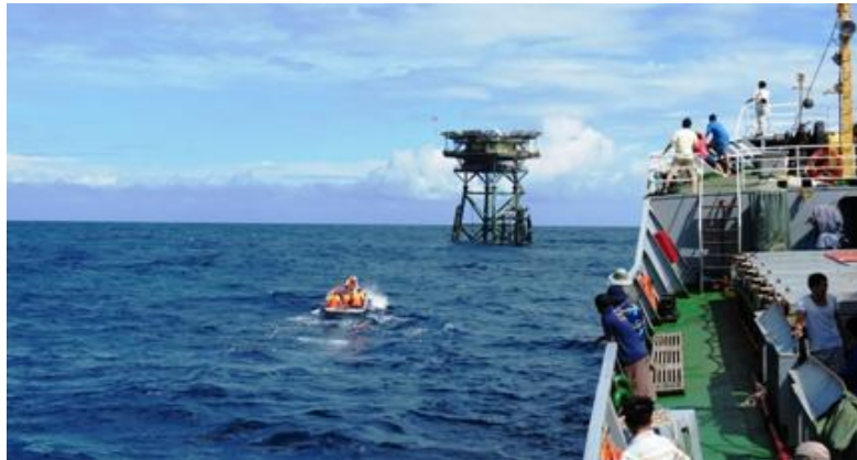
Tàu Hải quân đem quà xuân ra Nhà giàn DK1/11

“Một ba lô cây súng trên vai. Người chiến sỹ quen với gian lao”. Hành trang của người lính muôn đời vẫn là một tay súng, một chiếc ba lô, nhưng sự hy sinh và nỗ lực nhàn mà các anh đã trải qua thật khó nói hết bằng lời. Chiến tranh đi qua, cuộc sống của người lính biển đảo vẫn không một phút bình yên. Bởi ở nơi xa tiền tiêu Tổ quốc ấy, các anh đứng gác trong gió gào sương lạnh, làm nhiệm vụ thiêng liêng cao cả của mình để bảo vệ vùng trời vùng biển cho Tổ quốc.