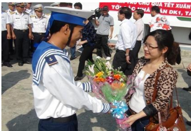
Niềm vui của chiến sĩ khi được khách đất liền ra thăm, chúc Tết

Còn bao chàng trai trẻ trong phút nhớ nhà, chỉ biết tâm sự với chính mình hay với sóng biển. Thế mới hiểu các anh trông đợi tin tức từ đất liền biết nhường nào. Nhiều khi cả hơn hai tháng mới có tàu thay trực. Nhận được thư người thân, lính đảo cứ truyền tay nhau đọc mà san sẻ niềm vui. Mỗi khi có đoàn ra giao lưu, các anh đều đón tiếp nồng nhiệt chân thành, để rồi bịn rịn lúc chia tay. Thời gian gặp nhau tuy ngắn ngủi, nhưng những lá thư xanh, dòng địa chỉ trao tay đã bù đắp phần nào nỗi cô đơn trong lòng họ.